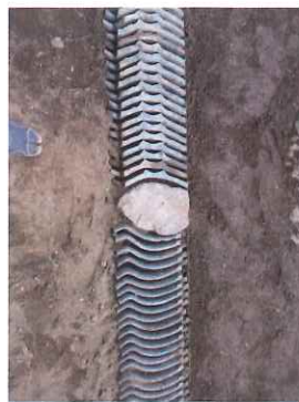
I邸 こんなリズム感 は冬、早春にピッタリ

た、構築物ではあるがメンテナンスが楽な三軒の庭をご提案いたします。K邸は足を踏み入れ易い植栽域を景石を用い高く盛り上げ、歩行空間は、切り石と砂利敷きで雑草対策を兼ねました。いまだ施工中のS邸は、和を演出した、廃棄される和瓦のコバを立ての通路づくりはSDGsな取組は庭師の最も自負するところ。