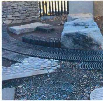
S邸 花崗岩と和瓦の調和を目指して

冬や早春の庭へ出たことがお有りだろうか？花や緑の少ない冬はともかく春先の泥濘（ぬかるみ）が、庭へ出なくなる最大の理由である。芝生を植えるのも良いアイディアの一つである。日本の芝は冬には枯れ、緑はない、それよりなによりメンテナンスが大変である。それを楽しむのが、ガーデニングの醍醐味である。その通りではありません、でも今号で施工中の庭と既に完成し