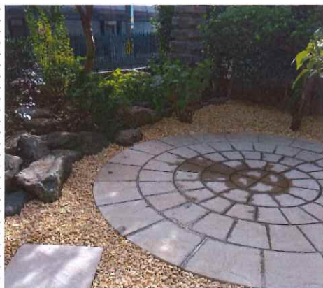
K邸 景石の植栽域を霜対策！